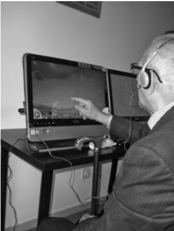
FIGURA 1: Interacción con la pantalla táctil.

GRADIOR consiste en ejercicios dinámicos diseñados para estimular toda la gama de habilidades cognitivas, facilitando la rehabilitación de funciones cognitivas como atención, percepción, orientación, cálculo, etc. En GRADIOR el usuario/paciente sigue una serie de instrucciones visuales y auditivas e interactúa con una pantalla táctil (aunque también puede utilizarse con ratón). La interfaz de pantalla táctil es más fácil de usar especialmente para adultos mayores con poca o ninguna experiencia con ordenadores y los estímulos presentados se pueden abordar directamente de una manera más conveniente e intuitiva que usando el ratón (Fig. 1).